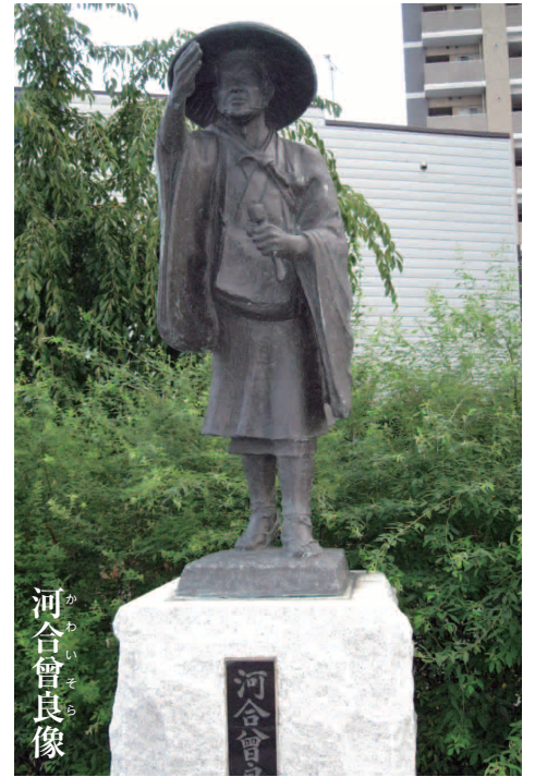
かわいそら 河合曾良像

古民家を改修した「草加宿神明庵」1階は観光案内所やお休み処、2階はギャラリーとなっており、草加宿への来訪者のおもてなしをしています。