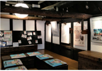
じんめいあん 神明庵

古民家を改修した「草加宿神明庵」1階は観光案内所やお休み処、2階はギャラリーとなっており、草加宿への来訪者のおもてなしをしています。