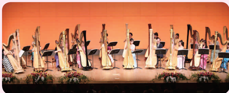
草加市文化会館でのコンサート

平成元年から毎年11月に、草加市で行われているフェスティバル。国内外から演奏者が参加し、草加全体がハープの音色に包まれます。平成27年のメインコンサートは、草加市文化会館にて11月14日(土)、15日(日)に行われます。