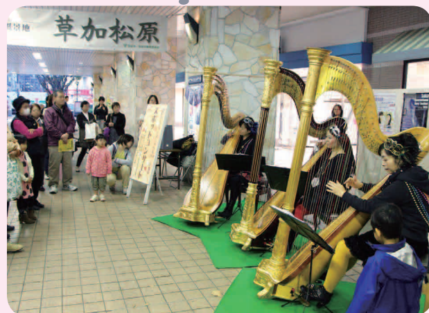
学校や駅構内でもコンサートが行われます。