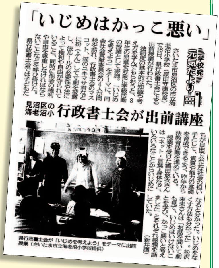
埼玉新聞 平成 27年 3月 20日

これからも埼玉県行政書士会は、あなたの街の行政書士、街の身近な法律家として「法教育」などの社会貢献活動に積極的に取り組んでいきます。