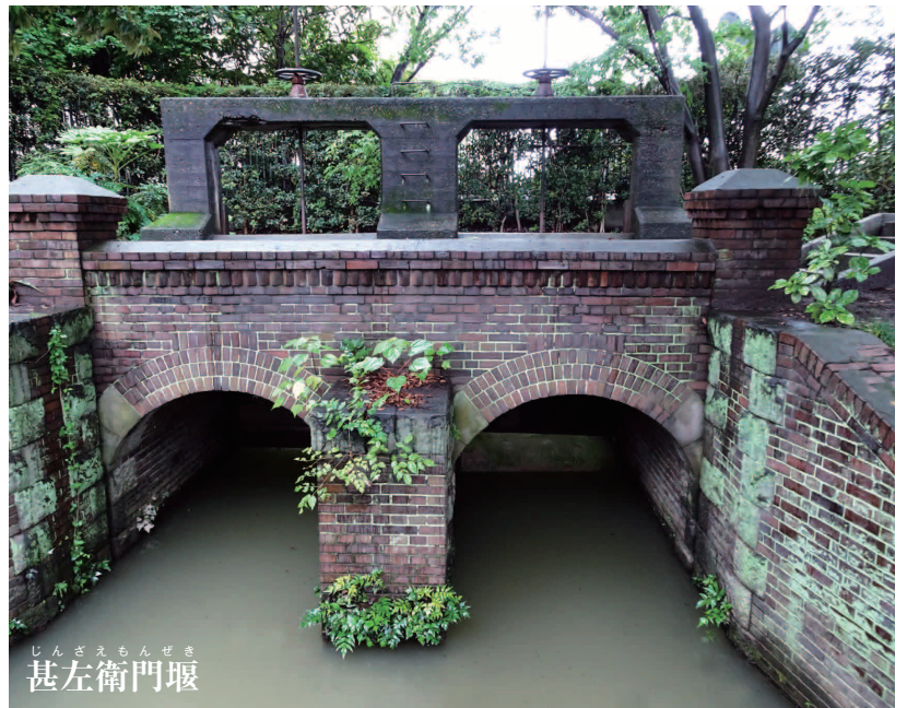
じんざえもんせき 甚左衛門堰

郷土の歴史資料や民俗資料を収蔵し、常設展示も行っていきます。(建物は国の登録有形文化財)