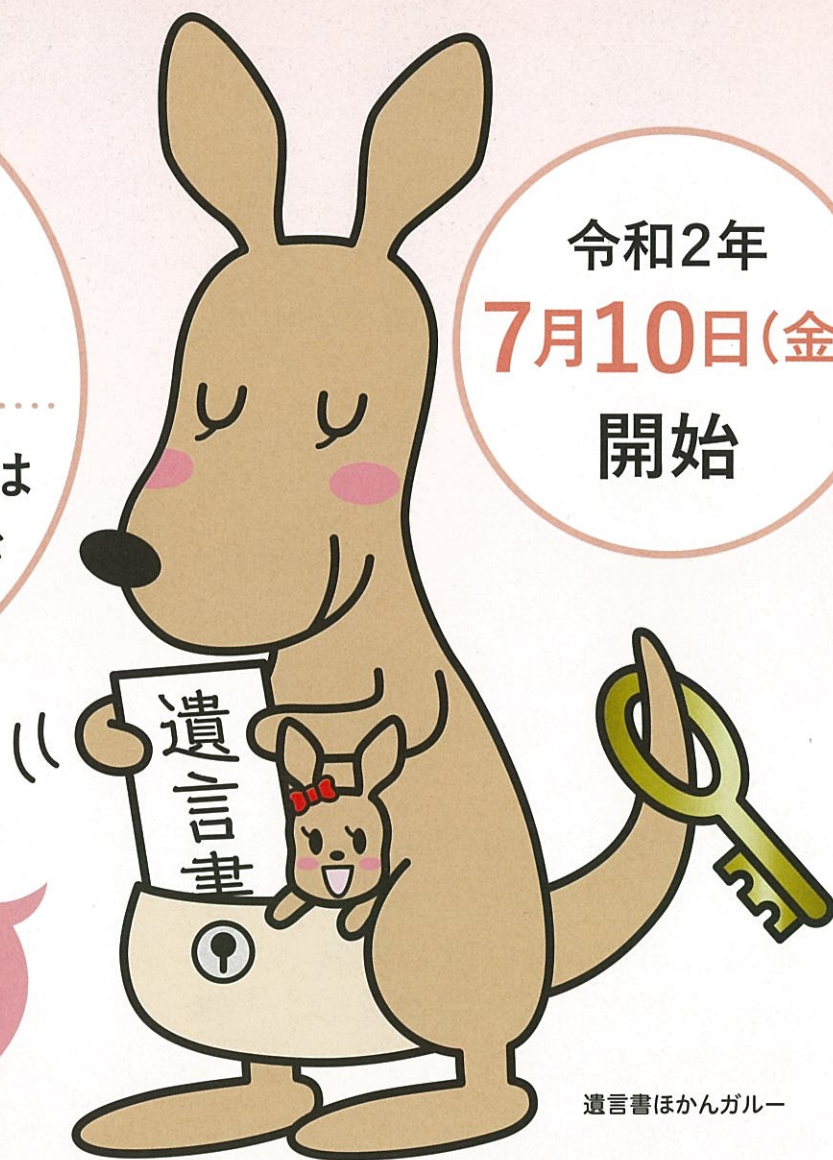
遺言書ほかんガルー